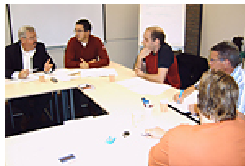
De fractie in discussie over de stellingen voor de StemWijzer.